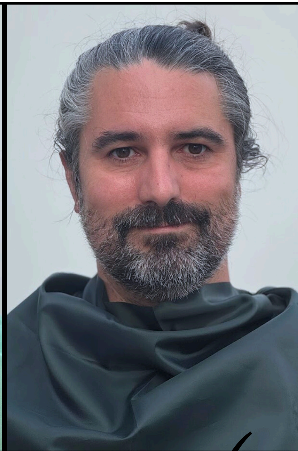
vert sapin ✓